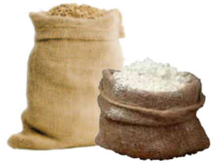
Grano Wheat, Blé, Weizen, Trigo

Su estructura completamente en acero inoxidable 304 y las 2 muelas templadas y rectificadas, exigen mínima mantención y aseguran eficiencia y notables prestaciones en el tiempo.