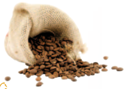
Caffè Coffee, Café, Kaffee, Café