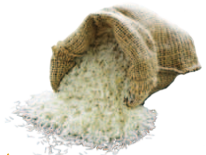
Riso Rice, Riz, Reis, Arroz