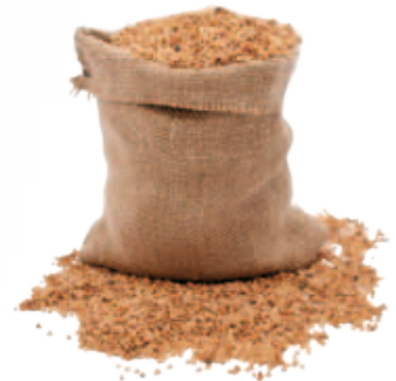
Orzo Barley, Orge, Gerste, Cebada