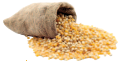
Mais Maize, Mais, Mais, Maíz